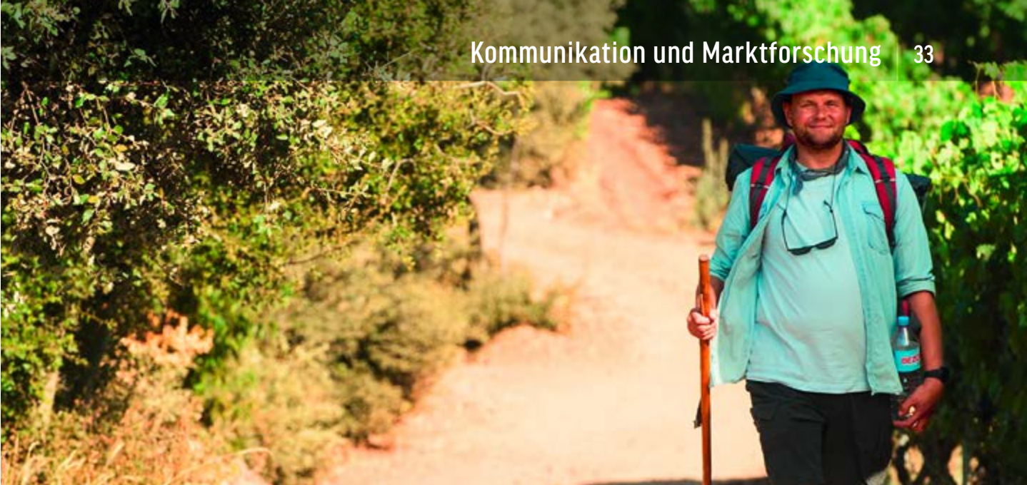
ICH BIN DANN MAL WEG | WARNER BROS.