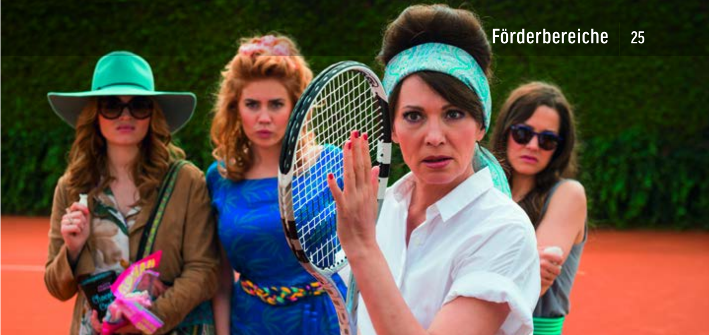
TRAUMFRAUEN | WARNER BROS.