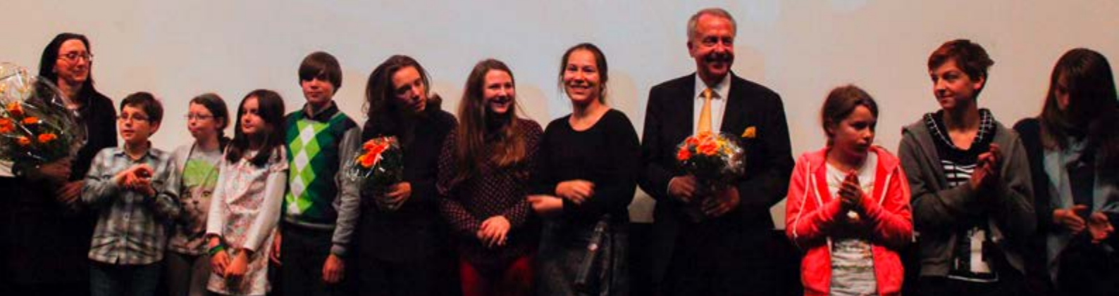
10 JAHRE VISION KINO