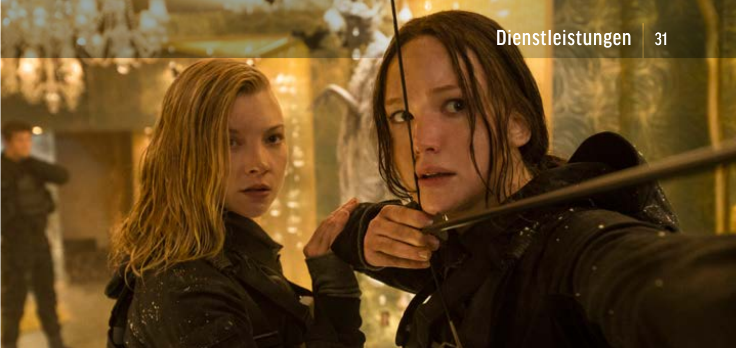
DIE TRIBUTE VON PANEM – MOCKINGJAY TEIL 2 | STUDIOCANAL