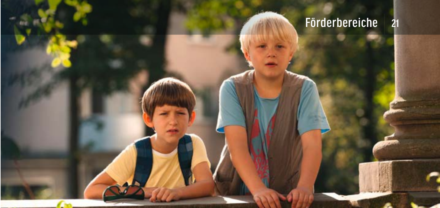
RICO, OSKAR UND DAS HERZGEBRECHE | 20TH CENTURY FOX