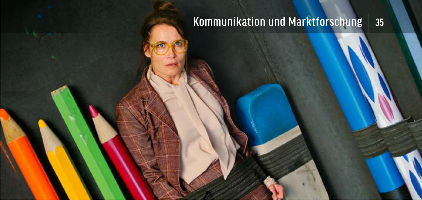
HILFE, ICH HABE MEINE LEHRERIN GESCHRUMPFPT | SONY PICTURES