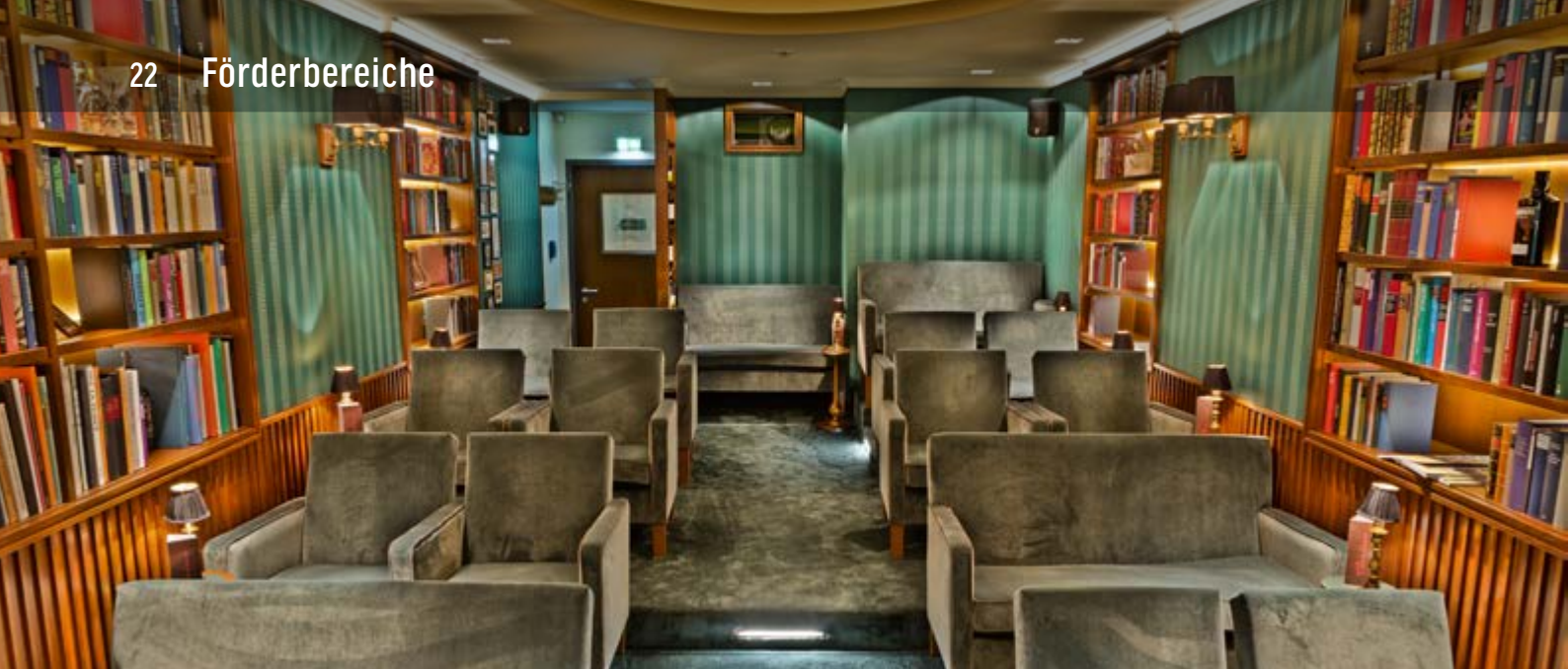
CASINO ASCHAFFENBURG