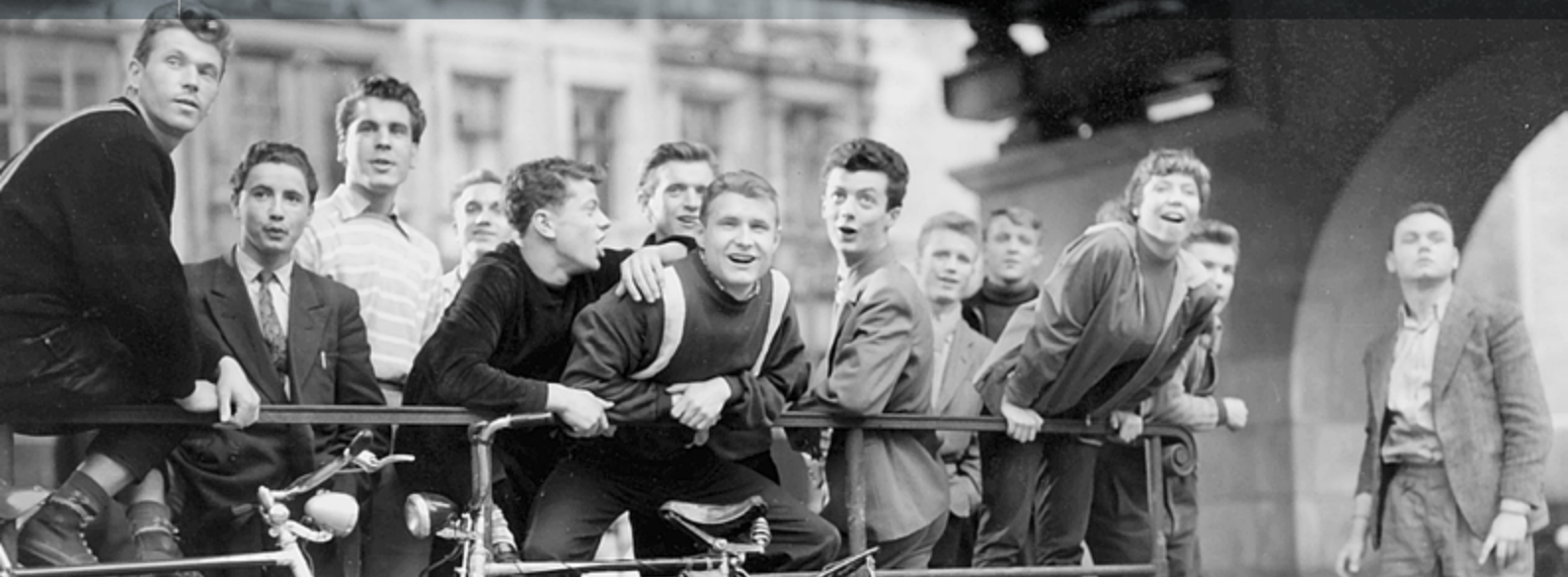
BERLIN – ECKE SCHÖNHAUSER