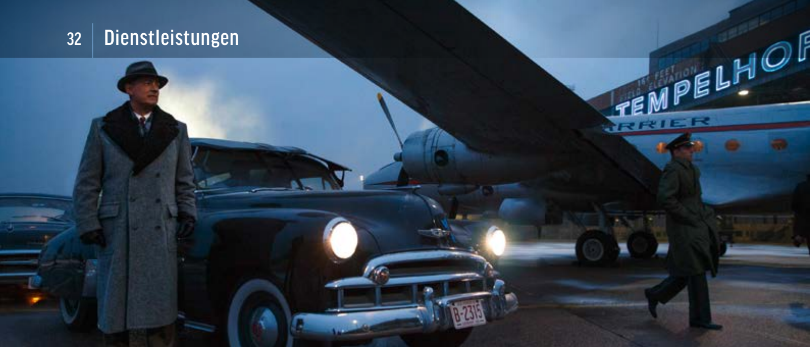
BRIDGE OF SPIES – DER UNTERHÄNDLER | 20TH CENTURY FOX