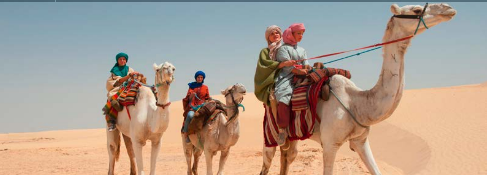
FÜNF FREUNDE 4 | CONSTANTIN