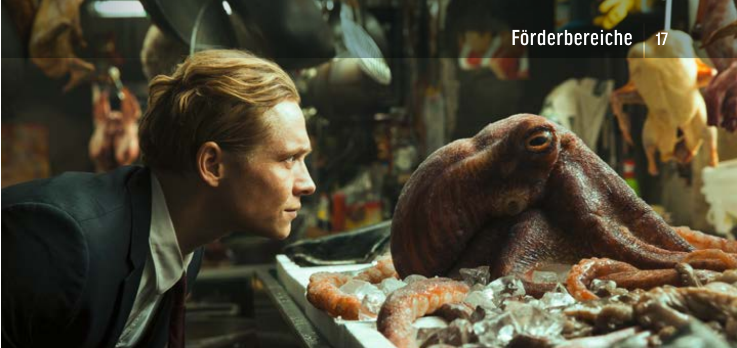
DER NANNY | WARNER BROS.