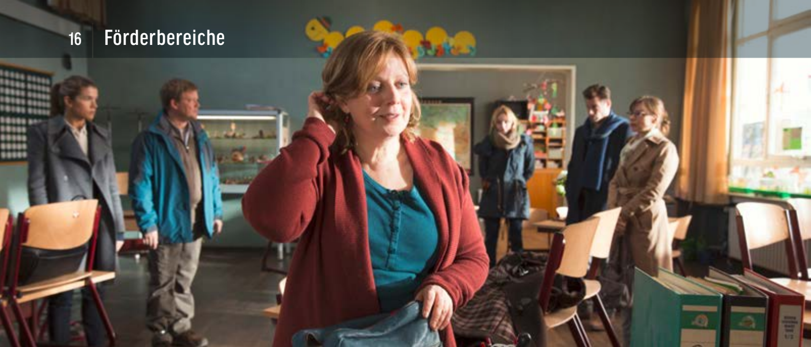
FRAU MÜLLER MUSS WEG! | CONSTANTIN

Elementare Aufgabe der FFA ist die Förderung des deutschen Films. Dies kann auf die unterschiedlichste Weise geschehen. In diesem Bericht spiegeln wir ein Gesamtbild der Förderaktivitäten der FFA wider. Es werden die einzelnen Förderbereiche dargestellt, und es wird dargelegt, welche Mittel in den einzelnen Bereichen eingesetzt wurden. Hier kann aber nur ein grundsätzlicher Überblick gegeben werden.