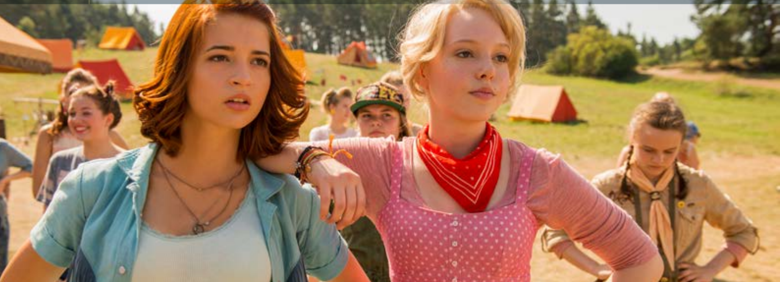
BIBI &amp; TINA – VOLL VERHEXT!